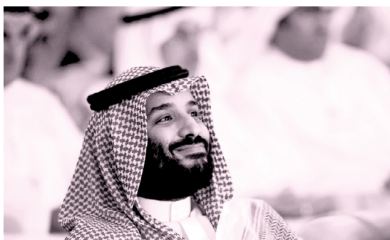
Ο νέος φίλος της ελληνικής δημοκρατίας