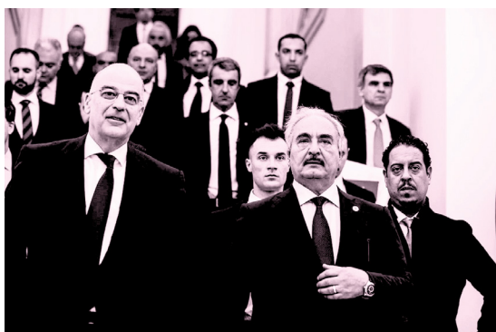
Μόνη απουσία ο ελληνόφωνος νάυαρχος