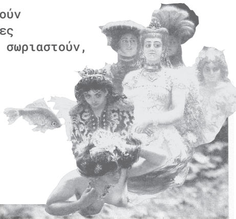
Το τραγούδι των Σκουληκιών Μάργκαρετ Άτγουντ

Όταν πούμε Επίθεση δεν θα ακούσετε τίποτα στην αρχή.