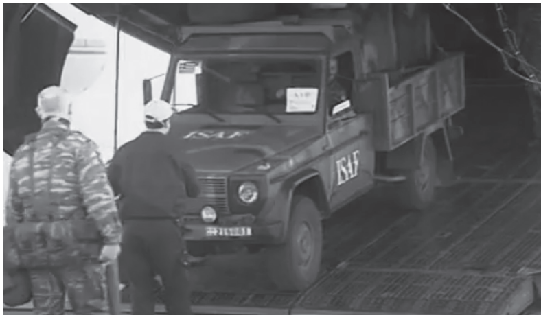
Φεβρουάριος 2002: Ο ελληνικός στρατός καταφτάνει στο αεροδρόμιο της Καμπούλ, για να παραδώσει μαθήματα "ελευθερίας" και "δημοκρατίας"

Στην ανατολική Μεσόγειο , η προοπτική διάλυσης του τουρκικού κράτους (ένα ενδεχόμενο το οποίο τη δεκαετία του '90 φάνταζε πιθανό) πήγαινε παρέα με ένα σύνολο από αντι-τουρκικές προβοκάτιες οργανωμένες από το ελληνικό κράτος και τις μυστικές του υπηρεσίες: το στρατιωτικό δόγμα του ενιαίου αμυνικού χώρου Ελλάδας-Κύπρου, οι συνεχείς στρατιωτικές ασκήσεις, οι εξοπλιστικές κούρσες και η υποστήριξη του κουρδικού αντάρτικου ήταν μόνο μερικές από τις «φιλειρηνικές ιδέες» που κατέβαιναν στα κεφάλια των Ελλήνων.