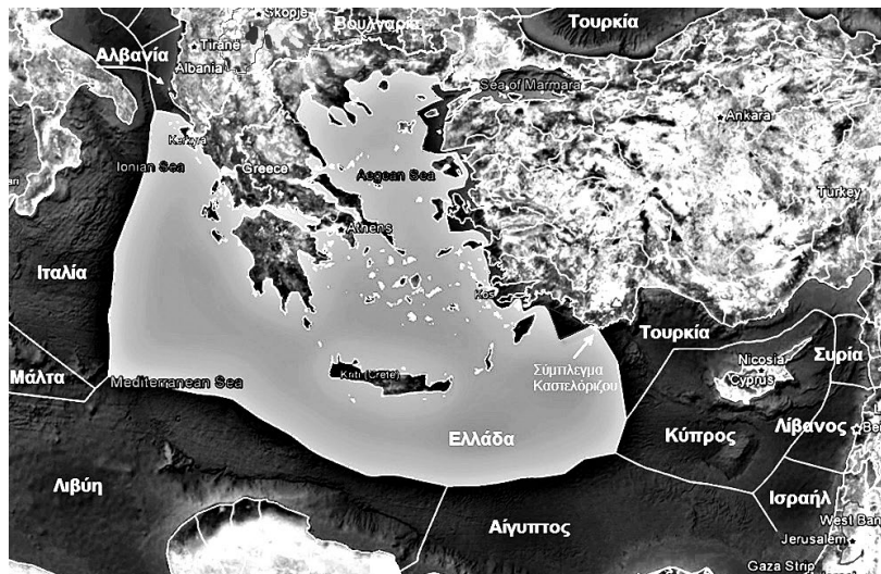
Εικόνα 1: Εδώ ο χάρτης που βλέπει κάθε πατριώτης και παραμιλάει. Στην κουτσουλιά Καστελόριζο λοιπόν, είχαν επενδυθεί πολλά. Τελευταία δεν τον πολυ-κυκλοφορούν αυτόν τον χάρτη. Η ελληνική εξωτερική πολιτική έχει μάθει να προσαρμόζεται με βάση τον συσχετισμό δυνάμεων στην περιοχή: πότε βρυχάται - ακόμα κι αν μοιάζει περισσότερο με ποντίκι - και πότε κλαίγεται για το «διεθνές δίκαιο».

περισσότερο μπαρούτι. Που άρχισε να (ξανα)αγριεύει πολύ εμφανώς επί κυβέρνησης σύριζα-ανέλ και τις αντι-τουρκικές τριμερείς Ελλάδα-Κύπρου-Ισραήλ. Τις κοινές στρατιωτικές ασκήσεις και την από τότε αποφασισμένη στρατιωτική «βάση-κλειδί» της Αλεξανδρούπολης. Και ενώ η «πρώτη φορά αριστερά» ή, για κάποια άλλα γούστα, «αριστερή παρένθεση», παρέδωσε τα σκίπτρα, δεν φάνηκε κάποια αλλαγή ρότας. Το αντίθετο: η κατεύθυνση ήταν η όλο και πιο έντονη πολεμική ρητορική και πρακτική. Οι βλακειές περί ΑΟΖ Καστελόριζου (μπορεί να δει κανείς στον χάρτη για τι κουτσουλιά πρόκειται), οι ακόμα μεγαλύτερες βλακειές για χωρικά ύδατα δώδεκα ναυτικών μιλίων και η προσπάθεια ορισμού ΑΟΖ μέσω συγκεκριμένων διακρατικών συμφωνιών, σκόπευαν