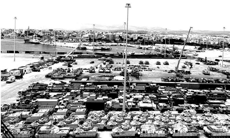
Εικόνα 2: Αλεξανδρούπολη, κάποια στιγμή τον Ιούνιο του '22. Ένα στιγμιότυπο από την «παρακάμψη» των στενών του Βοσπόρου για μεταφορά στρατιωτικού εξοπλισμού. Αν αυτό δεν είναι συμμετοχή στον πόλεμο, τότε τι είναι;

Κάπως έτσι είναι που το ελληνικό κράτος έστειλε από την πρώτη στιγμή στρατιωτικό εξοπλισμό στον ουκρανικό στρατό - και συνεχίζει να το κάνει. Κάπως έτσι είναι που θεωρείται κάτι όχι-και-τόσο-σημαντικό η επιμελητική υποστήριξη στον αμερικάνικο στρατό: μέσω της όλο και πιο κομβικής βάσης της Αλεξανδρούπολης, της Σούδας, του Στεφανοβίκειου και των σχεδίων για επέκτασή τους, μέσω της εναέριας «συλλογής πληροφοριών» από τα εμπόλεμα πεδία, μέσω των στρατοπέδων εκπαίδευσης μισθοφόρων. Αλλά και με πολλούς ακόμα τρόπους. Και, για άμεσο αντάλλαγμα, ένας μόνιμα παρκαρισμένος νατοϊκός στρατός φυλάει τα σύνορα και λειτουργεί, εντέλει, ως ελληνικός στρατός απέναντι στην Τουρκία.