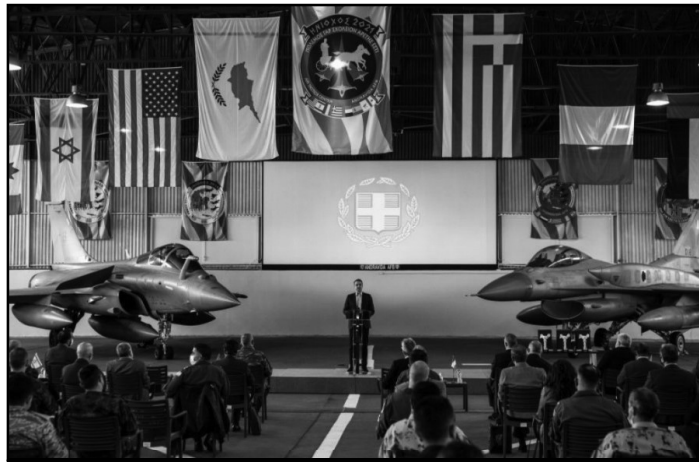
εικ. 5: Στιγμιότυπο από την έκθεση DEFEA (Defence Exhibition Athens) από το 2021. Το πανό πίσω λέει «πόλεμος γαρ σχολείον αρετής εστί». Χρονιά που ήταν, θα αναφέρεται λογικά στον πόλεμο με τον άρατο εχθρό.

Όταν λοιπόν μιλάνε για «ανάκαμψη της αμυντικής βιομηχανίας», εννοούν ότι τα σφαγεία θα συνεχίζονται και θα εντείνονται. Εννοούν ότι οι μισθοί μας θα ταΐζουν ασταμάτητα την πολεμική τους μηχανή, απλά με πιο γαλανόλευκο φόντο. Εννοούν ότι αυτοί εδώ πρώτοι απ'όλους βλέπουν το πολυεθνικό προλεταριάτο, βλέπουν εμάς, ως αναλώσιμους στα σχέδιά τους.