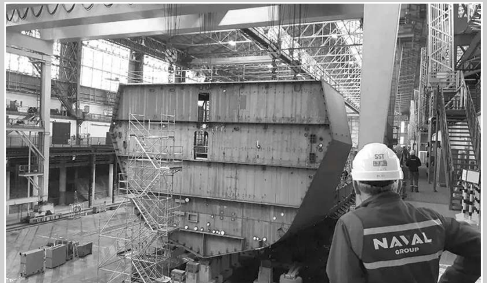
εικ. 3 & 4: Αριστερά η φρεγάτα Ύδρα ξεκινάει για την Ερυθρά Θάλασσα για την προστασία των ελλήνων εφοπλιστών. Δεξιά η κατασκευή blocks της bellhara Φορμίων στα ναυπηγεία Σαλαμίνας. Ποιος είπε ότι δεν έχουμε βιομηχανία;