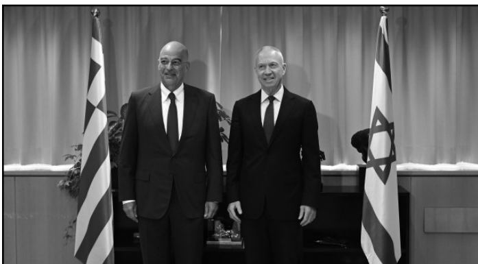
εικ. 2: Δύο υπουργοί πολέμου μας χαμογελάνε όλο νόημα - στιγμιότυπο από την συνάντηση Δένδια - Γκάλαντ στις 7 Αυγούστου 2023 στο Τελ Αβιβ, όπου τα όπλα αποτελούσαν κεντρικό θέμα.

Όλο και περισσότερα όπλα made in greece λοιπόν και πού είναι το πρόβλημα;