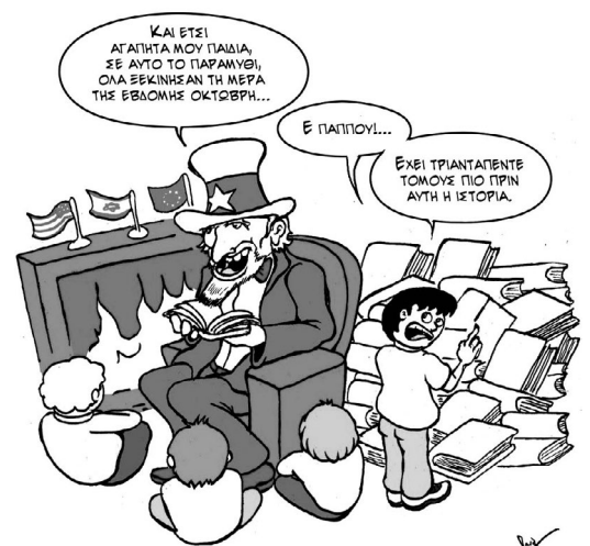
Σκίτσο του Πανάγου, 08/10/2024

Στην πράξη, η στρατηγική της Χεζμπολάχ είχε σαν αποτέλεσμα τουλάχιστον 600.000 έποικοι να αδειάσουν τον βορρά και να μετακινηθούν αρχικά νότια ή ακόμα και να εγκαταλείψουν προσωρινά τη χώρα, δημιουργώντας πολιτική φθορά και προβλήματα στη συνοχή της κοινωνίας στο ισραηλινό κράτος. Τέτοια ζητήματα δεν επιλύονται από καμιά στρατιωτική υπεροπλία. Η στρατηγική της