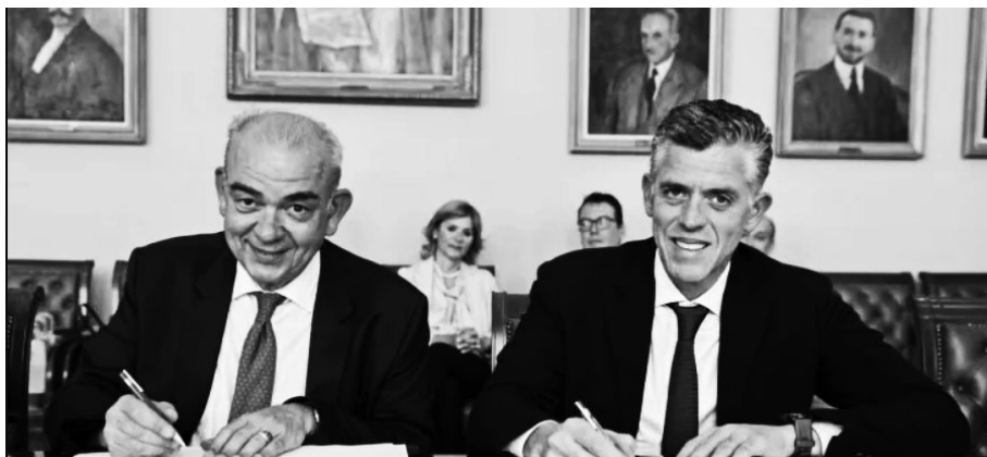
Εικόνα 2. Χαμόγελα και αγκαλιτσες με τον Κοπελούζο.