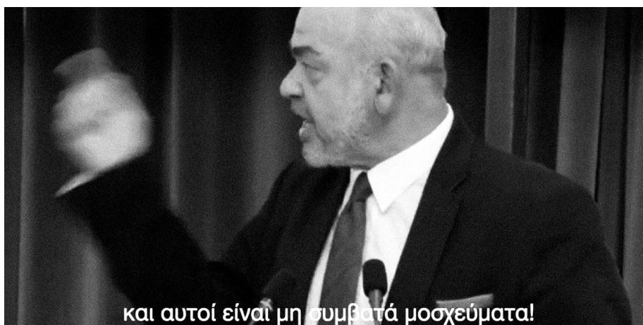
Εικόνα 3. Director's Cut από την Βραδιά του Ερευνητή. Το Αθηναϊκό-Μακεδονικό Πρακτορείο Ειδήσεων φρόντισε να διορθώσει αυτήν την στιγμή απόλυτης ειλικρίνειας στην μονταζιέρα.

Οι δύο τελευταίες προτάσεις κόπηκαν από το επίσημο βίντεο του Αθηναϊκού-Μακεδονικού Πρακτορείου Ειδήσεων που έχει αναρτηθεί στο Youtube και κυκλοφόρησαν αργότερα σε άλλα μέσα. Και δεν θα αδικήσουμε αυτούς κι αυτές που έσπευσαν να σχολιάσουν ότι η πρόταση αυτή είχε έναν αέρα επταετίας, αν όχι ευγονικής.